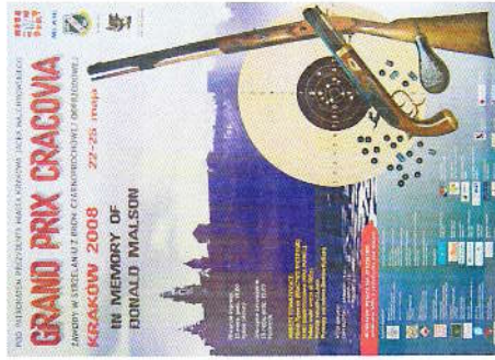
Plakat I GP Cracovia 2008