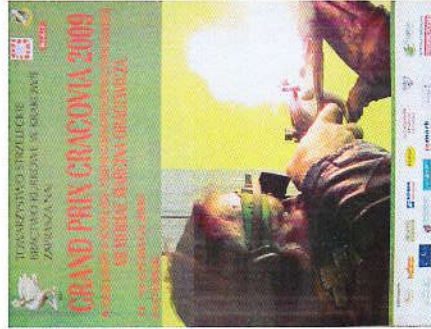
Plakat II GP Cracovia 2009