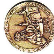
Medale II GP Cracovia 2009